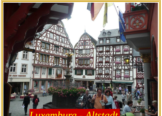
Luxemburg - Altstadt